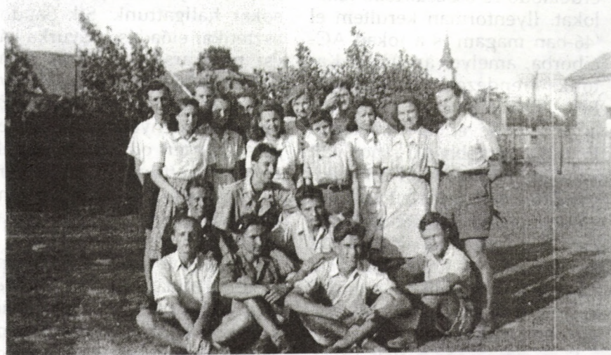
Egykori fénykép a debreceni közösségek tagjairól Gyulán

Az új piarista tanár urak nemcsak tanítani akartak a gimnáziumban, hanem különféle egyéb módon is foglalkoztak diákjaikkal (cserkészlet, éneklés, bábozás, kölcsönkönyvtár), sőt a lányokat is igyekeztek bevonni.