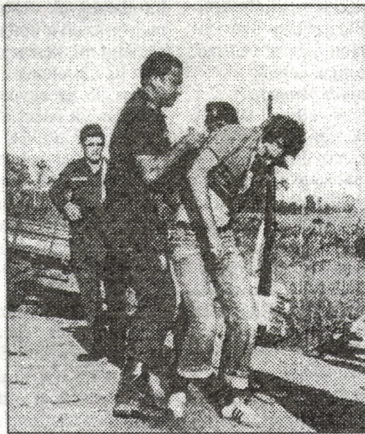
Erwin Kräutler püspök 1983-as letartóztatása

Egyébként nem valami tekintélyi figuraként járkálok. Az emberek ugyanúgy tegeznek, ahogy a testvéreiket tegezik. Excellenciás úr, főtisztelendő úr, ilyen marhaságok, ilyen megszólítási formák ott nem léteznek. Dom Erwin vagyok, és ezzel kész... Az emberek teljesen magától értetődően viselkednek velem, mint egyenlők az egyenlővel. Ha valamelyik egyházközségben együtt eszünk, akkor a férfiak sorába állok be. Ez utoljára kerül sorra, a gyerekek és a fiatal szülők, valamint a nők után. Ha nincs elég evőeszköz, akkor pusztá kézzel esszük a halat... Nem esik le a gyűrű az ujjamról, ha ilyen testvéri módon vagyok együtt az emberekkel. A plébános úri és méltóságos püspöki allűröknek nincs helyük a szegények egyházában. Az effajta fellépéseknek Jézushoz sincs semmi közük, ahogyan a