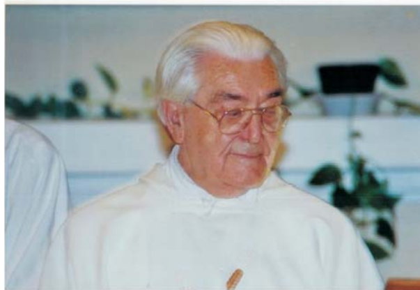
A gyémántmisés pap